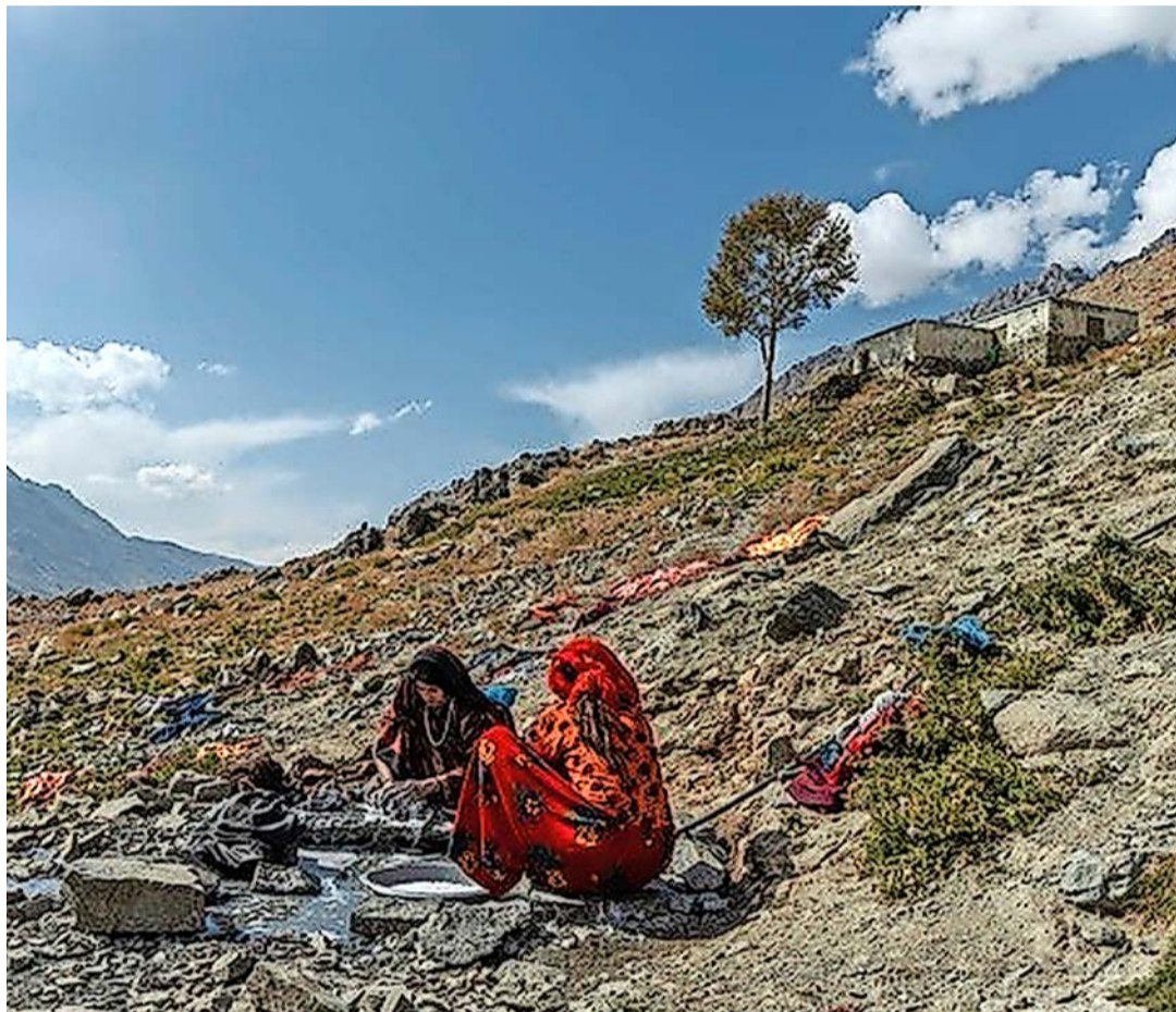
Afghaninnen waschen Kleider an einer Quelle im Hindukusch.

Die Machtübernahme der Taliban im August 2021 hat vieles verändert. Auf seinen Reisen durch das Land begegnete der Schaffhauser vielen bewaff-