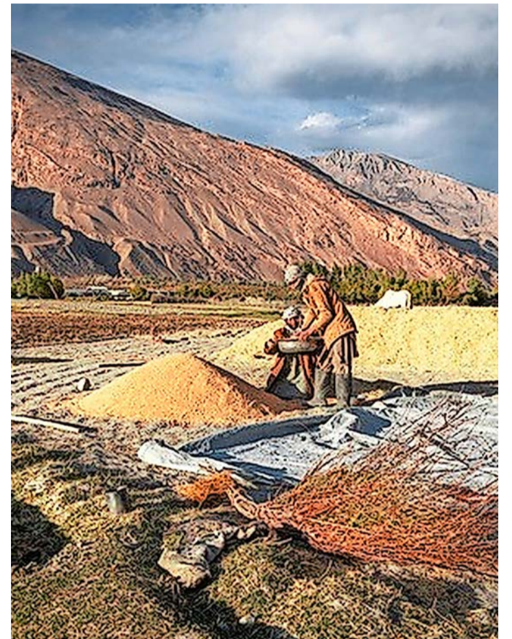
Arbeiter bearbeiten auf einem Feld Getreide für den Winter.